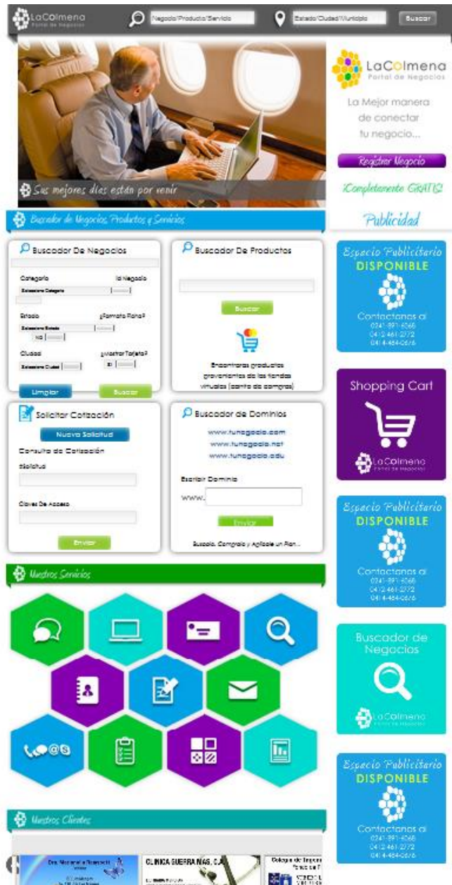
Portal de Negocios de LaColmenaVe.com –La mejor manera de conectar su negocio

Permítanos darle la bienvenida y hacerle una breve exposición referente a quiénes somos y qué es nuestra herramienta La Colmena – Portal de Negocios.