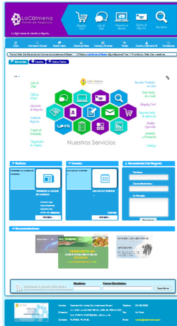
Página web del cliente – totalmente parametrizable

InfoGlobVE viene a ser la herramienta perfecta para ahorrar dinero cuando se habla de promoción de negocios en internet.